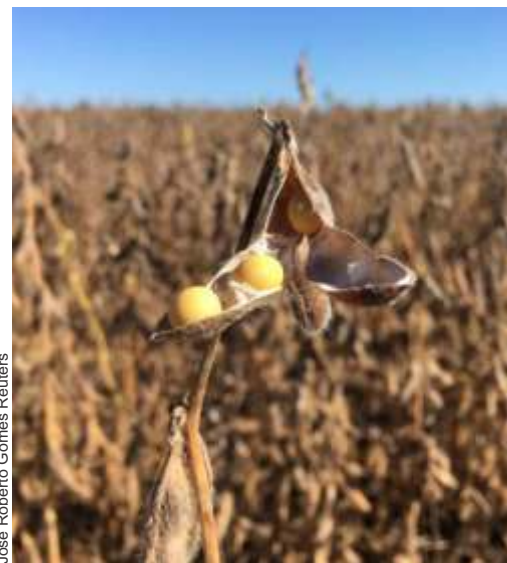
José Roberto Gomes Reuters

e 1.200km recuperados nas rodovias estaduais, em todas as regiões de Mato Grosso. Além das obras em andamento, o Governo do Estado já planeja a construção de outras 114 pontes de concreto em Mato Grosso, bem como a substituição de pontes de