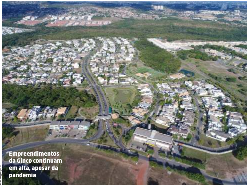
Empreendimentos da Gincó continuam em alta, apesar da pandemia

“A baixa dos juros praticados no mercado influencia e impulsiona diretamente o setor produtivo da habitação,