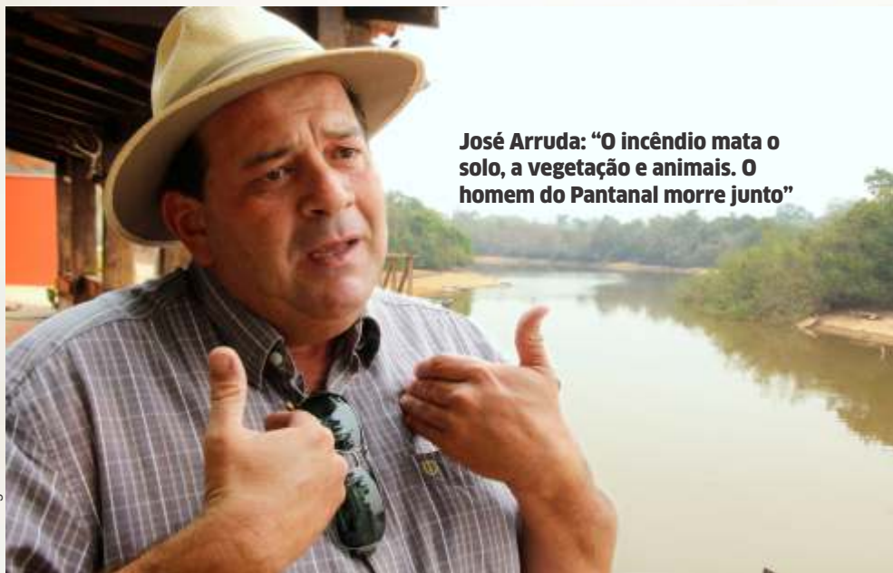
José Arruda: “O incêndio mata o solo, a vegetação e animais. O homem do Pantanal morre junto”

Correndo por fora, uma força-tarefa do Governo de Mato Grosso já aplicou, desde janeiro, R$ 190 milhões em multas relacionadas a incêndios florestais e queimadas ilegais. As autuações foram feitas por meio dos órgãos que compõem o Comitê Estratégico para o Combate do Desmatamento Ilegal, a Exploração Florestal Ilegal e aos Incêndios Florestais (CEDIF-MT). Mauren Lazzaretti reconhece que