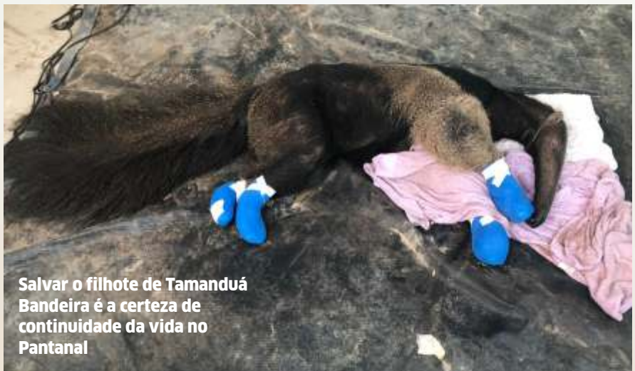
Salvar o filhote de Tamanduá Bandeira é a certeza de continuidade da vida no Pantanal